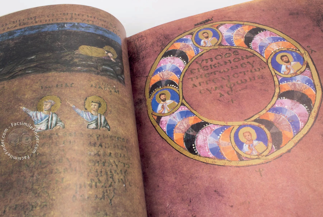
Codex Purpureus Rossanensis Manoscritto conservato nel Museo diocesano e del Codex a Rossano in provincia di Cosenza In copertina Castello di Corigliano Provincia di Cosenza