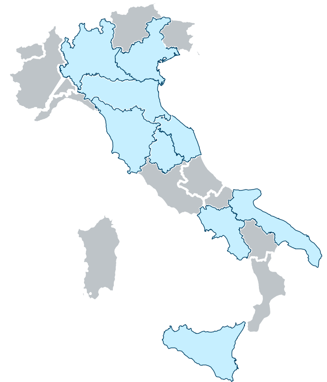
Copertura regionale dei Centri di riferimento SIOMMMS selezionati